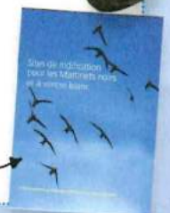
Brochure sur les martinets dans la construction

Rédaction et mise en page: Marie Gallot. Dessins: Ludovic Bergonzoli.